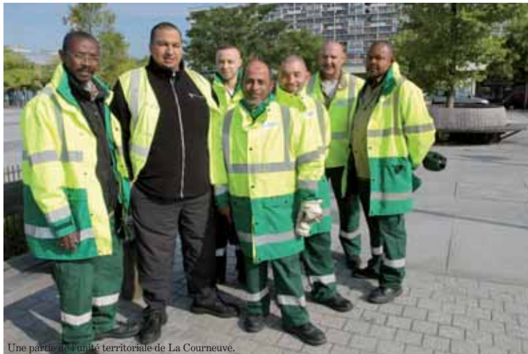
Une partie de l'unité territoriale de La Courneuve.