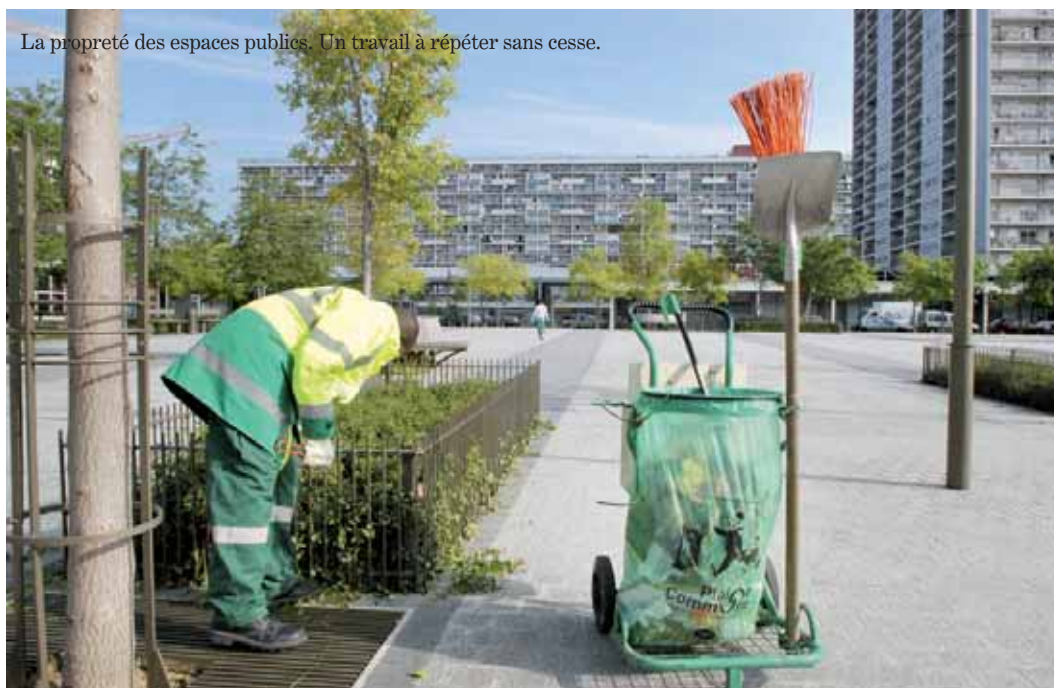
La propreté des espaces publics. Un travail à répéter sans cesse.