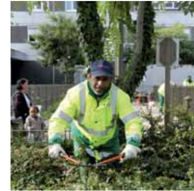
Le moment de la taille des buissons.

Dans deux mois, en servant de ligne directe pour tout ce qui aura trait à l'espace public du territoire, le numéro conservera sa double fonction : renseigner et solutionner. Mais pour passer d'un standard spécialisé à un véritable call center capable de répondre à 45 000 appels