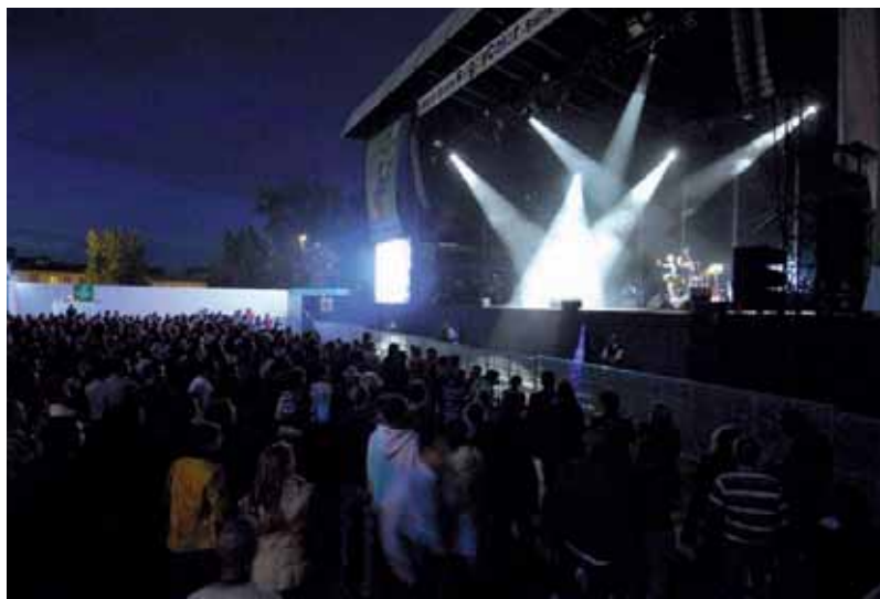
RUGBYCOLOR. Grande scène et vaste public.

19h concert Plantec 21h retransmission Finale 22h40 concert The Rakes