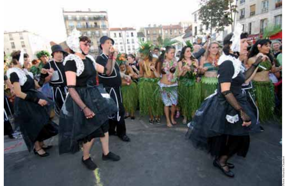
Mélange des cultures dans les rues de Saint-Denis.