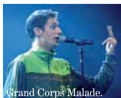
Grand Corps Malade.

lètes sont-ils des modèles? » et « Médias, fédérations, CIO, États, qui gouverne le sport? ». Enfin, le 20 octobre, place aux rapports nord-sud pour « Un autre sport dans un autre monde ».