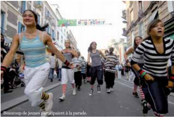
Beaucoup de jeunes participaient à la parade.

La Coupe du monde de rugby, qui se déroule dans dix villes françaises jusqu'au 20 octobre, arrive tous les week-ends autour du Stade de France et du village RugbyColor à Saint-Denis. Trente concerts gratuits sont proposés, ainsi que des débats, la retransmission des matches sur écran géant... La Mêlée des Mondes, en ouverture le 8 septembre dernier, a réuni dans les rues de la ville une foule innombrable et un millier de participants venus de plusieurs villes de Plaine Commune.