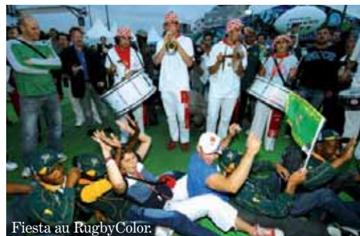
Fiesta au RugbyColor.

et environnementale. Par ailleurs, l'opération « Du coq à l'art », initiée par le rugbyman Cédric Soulette, a confié à des artistes (le grapheur Marko à Saint-Denis) le soin de peindre un gallinacé de deux mètres de haut. Une vente aux enchères sera organisée au profit d'enfants malades. Dans le Forum du sport, une dizaine d'artistes exposent des toiles hautes en couleurs et effets, sur la pratique ovale. Salle de la Légion d'honneur, dans le centre de Saint-Denis, « Allez les petits » est une exposition ludique qui veut faire découvrir le sport aux enfants. Au musée d'art et d'histoire de la ville, Marco Polo et le livre des merveilles réunit de nombreuses pièces, notamment près de 150 objets provenant du musée Guimet à Paris. À la mi-temps de la Coupe du monde, au compteur de la réussite, la marque est déjà élevée. Julien Lafargue