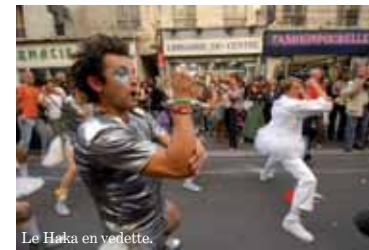
Le Haka en vedette.

part des rencontres, en direct du Stade de France et des autres enceintes. TF1 et Eurosport ont l'exclusivité de ces transmissions, et la ville de Saint-