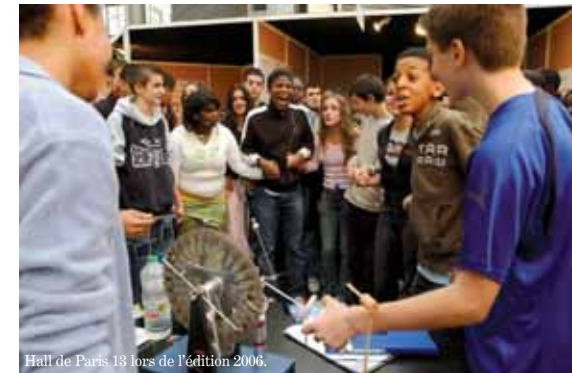
Hall de Paris 13 lors de l'édition 2006.

Programme complet : savantebanlieue.plaineccmune.fr.