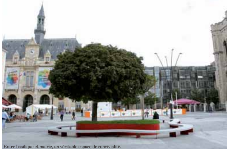
Entre basilique et mairie, un véritable espace de convivialité.

La place Victor-Hugo, inaugurée le 1 er septembre, constitue l'avant-dernière étape de la restructuration globale du centre-ville.