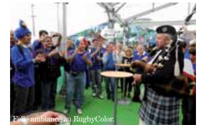
Belle ambiance au RugbyColor.

l'écran géant. Auparavant, les 13 et 14 octobre, ce seront les deux demi-finales. Les 6 et 7 les quarts de finale, les 29 et 30 septembre Roumanie-Nou-