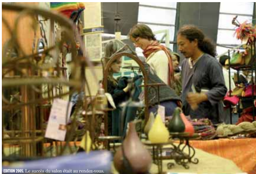
EDITION 2005. Le succès du salon était au rendez-vous.

En 2005, près de onze mille visiteurs s'étaient rendus à la première édition du salon international pour un commerce équitable. Combien seront-ils du 26 au 29 octobre prochain sous la nef de l'Île des Vannes, à L'Île-Saint-Denis ? Même lieu, même durée, même profil de manifestation, même gratuité d'accès. Comme en rugby où on ne change pas une équipe qui gagne, les organisateurs d'EquitExpo 2007 veulent transformer l'essai marqué voici deux ans. L'unique salon en France consacré à cette économie respectueuse des hommes et de leur environnement a pris encore du poids et des centimètres. Pratiquement le double d'exposants -200 venus d'une trentaine de pays- est annoncé. Ils sont producteurs de biens et de services, importateurs de denrées alimentaires ou d'artisanat, grossistes, responsables de structures financières solidaires ou de réseaux de distribution alternatifs, médias indépendants etc. Ces